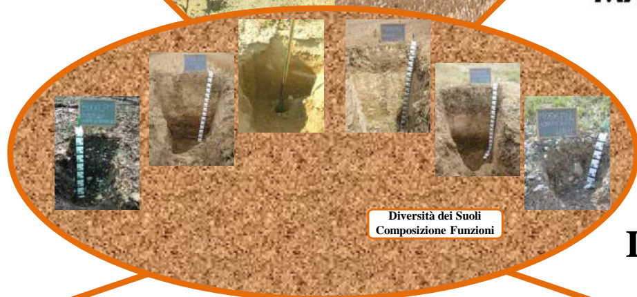
Diversità dei Suoli Composizione Funzioni

Servizio Ambiente e Agricoltura, PO Monitoraggio Suoli (Sede decentrata Treia) Tel./fax. 0733 - 217285 Mail: infosuoli@regione.marche.it Web: http://agricoltura.regione.marche.it http://suoli.regione.marche.it/