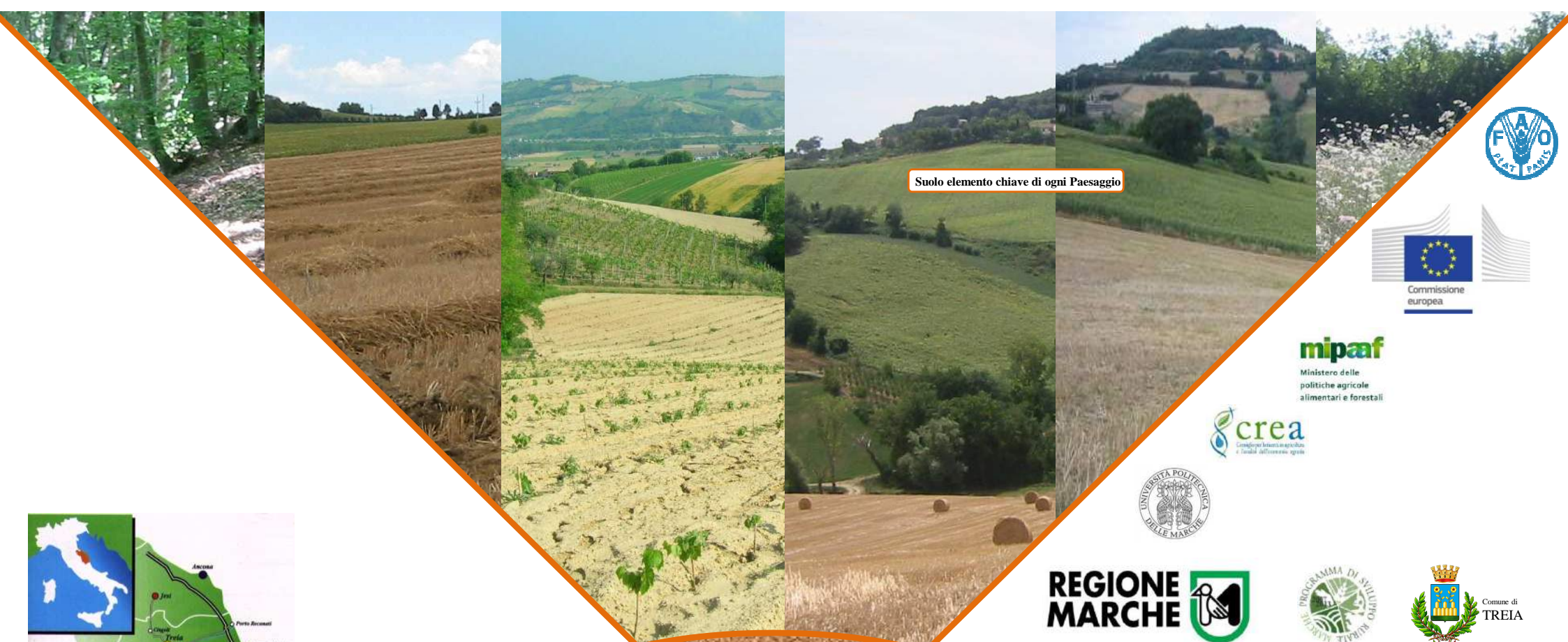
Suolo elemento chiave di ogni Paesaggio